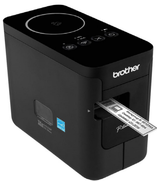
Máy in nhãn